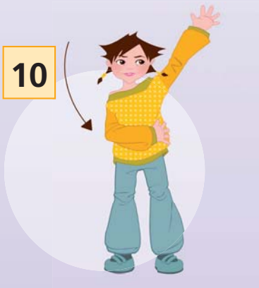
„... THE TIME ...“ (rechter Arm an die linke Hüfte)