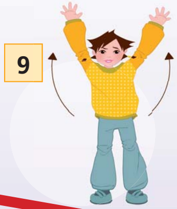
„... DO ...“ (beide Arme hoch)