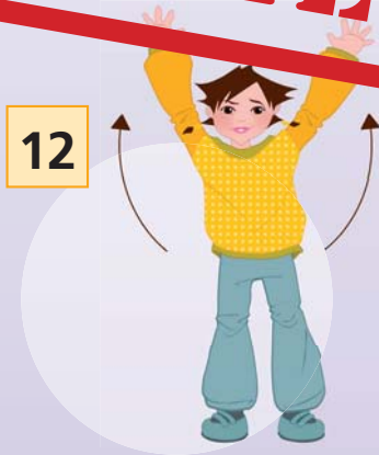
„... AGAIN!“ (Arme langsam nach oben über den Kopf führen)