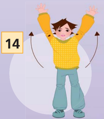
„... THE TIME ...“ (rechter Arm nach oben)