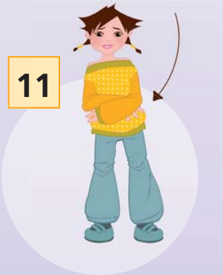
„... WARP ...“ (linker Arm über den rechten Arm an die rechte Hüfte führen)