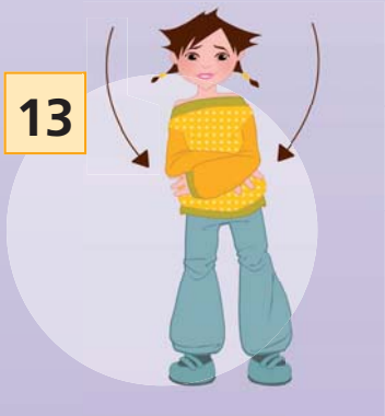
„LET'S ...“ (rechter Arm an die linke Hüfte)