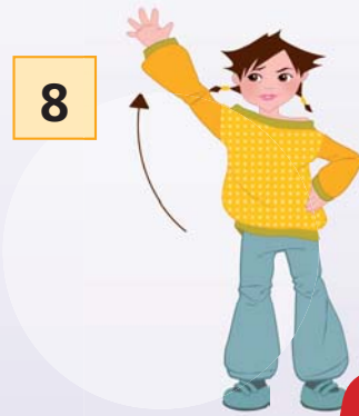
„LET'S ...“ (rechter Arm hoch)