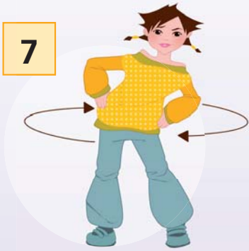
„THAT REALLY DRIVES YOU INSANE.“ (Hüfte im Uhrzeigersinn kreisen lassen)