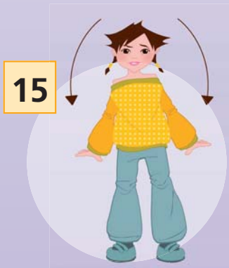
„... AGAIN!“ (beide Arme nach unten führen auf Hüfthöhe)