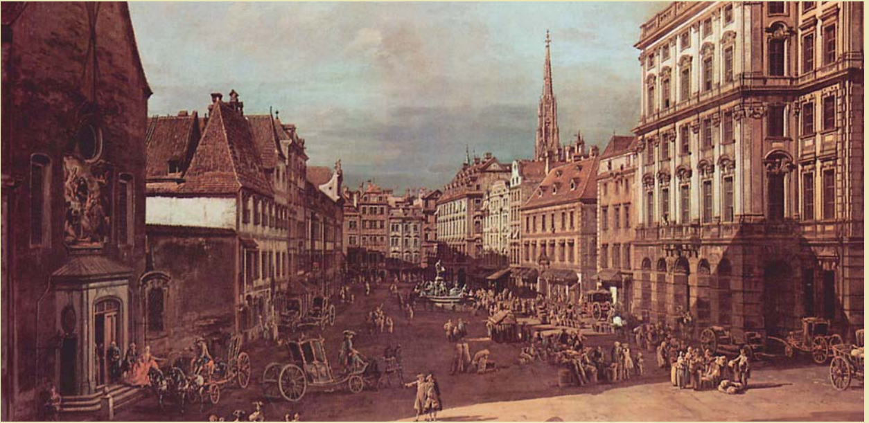
Ein Platz in Wien zu Mozarts Zeit